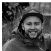
Max Akquise & Support